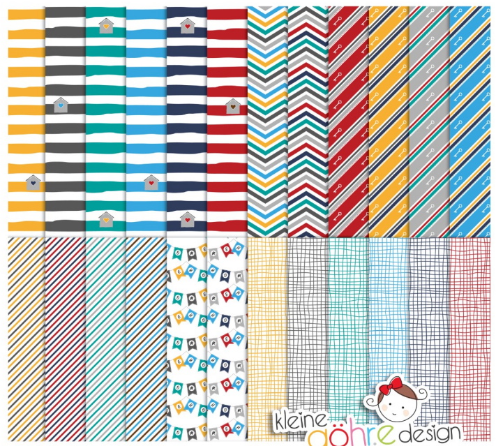
digitale Papiere "Zum neuen Heim Streifen&Co"