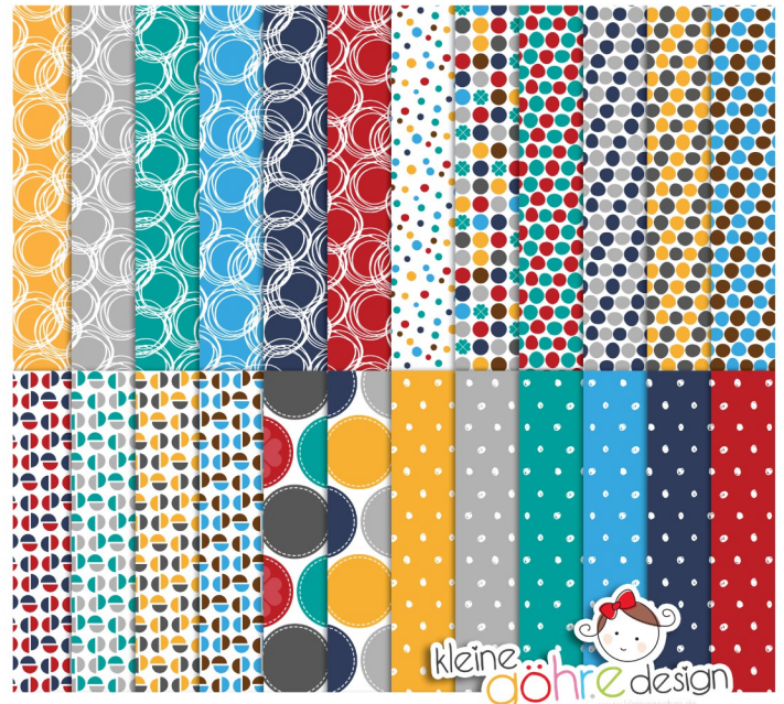
digitale Papiere "Zum neuen Heim Punkte"