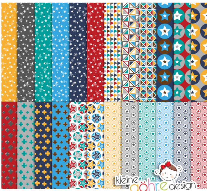
digitale Papiere "Zum neuen Heim Sterne&Co"